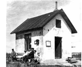
Tullhuset, bilden tagen omkring år 1925.

Tullhuset i hamnen ägdes av Skånska Cementaktiebolaget. De höll tullaren med hus eftersom hamnen var privatägd. Originalhuset finns inte kvar men ett nytt hus är byggt i närheten med exakt samma proportioner och platsen heter Tullhustorget.