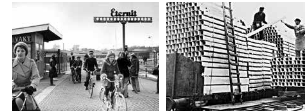
Ventilationsrör av eternit

Skandinaviska Eternitaktiebolaget grundades av Skånska Cement som ersättningsindustri för cementfabriken. Huset som finns kvar var huvudkontor och byggdes på 1940-talet. Eternit är en asbestcementplatta, ca 20 % asbest, 80 % cement. Den är lätt, eldsäker, värdertålig och lätt att såga och borra i. Många halmtak ersattes med eternitplattor. Namnet Eternit är avlett från latinets "aeternitas", evighet. Efterhand framkom det att eternitens asbestcement var hälsovådligt då asbestfibrer kan tränga in i lungorna och orsaka asbestos, och många arbetare fick sätta livet till. Fabriken stängdes 1977.