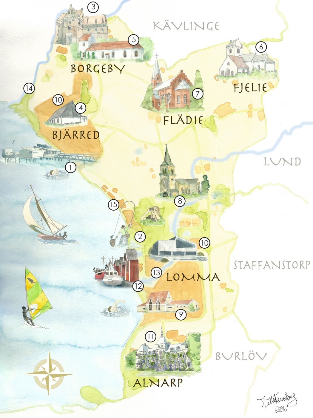
Illustration: Mette Koverberg